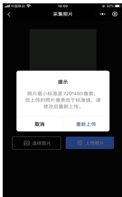
照片像素不符合标准

6. 图片上传成功后, 进入“微信支付”页面, 请点击“微信支付”, 进行付款, 付款成功后进入“审核页面”。因后台核验工作较多, 审核时间较长, 请同学们耐心等待并关注审核结果。审核完成后, 小程序会以短信息的方式提示审核成功, 同学可登陆小程序进行查看。如照片审核失败, 需要重新采集, 采集步骤如上。