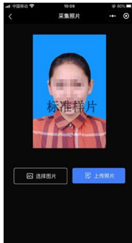
选择照片进行上传