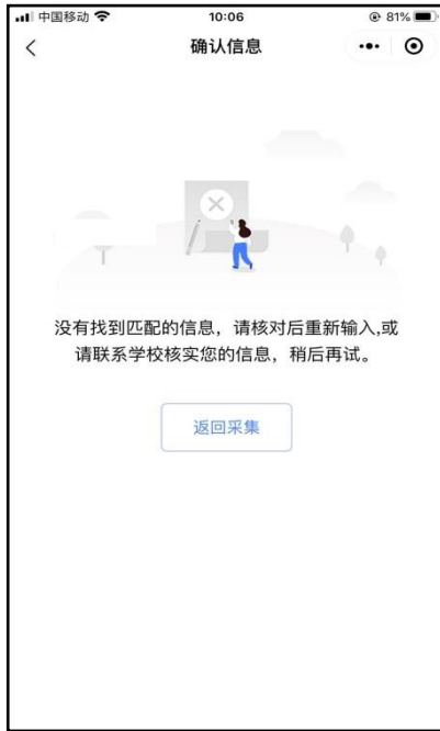
信息无法确认页面